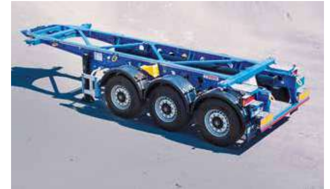
Porta-contentores fixo tipo basculante