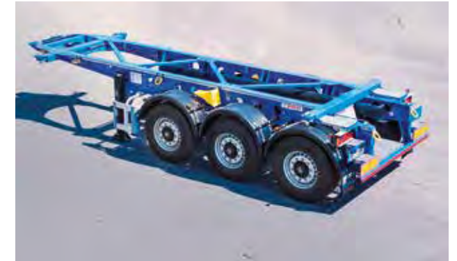
Portacontainer fisso tipo ribaltabile